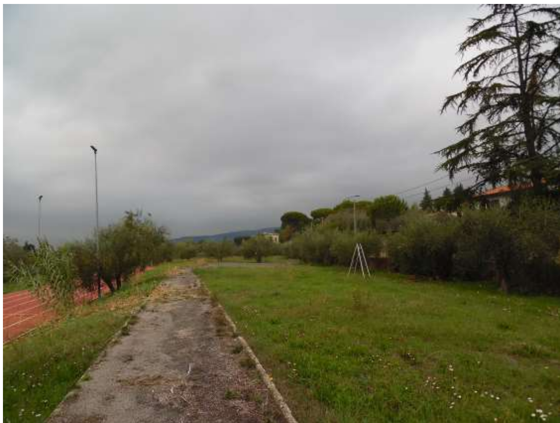
53_Vista dal percorso pedonale sull'ultimo balzo verso il confine con la particella 142 foglio 37.