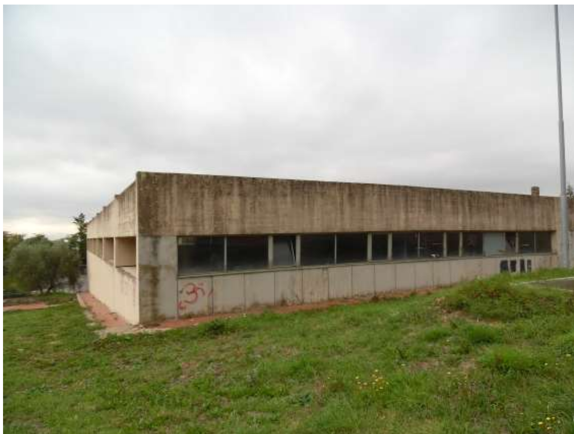
24_ Vista del prospetto tergale della palestra e di quello lungo il confine con Villa Ragionieri.