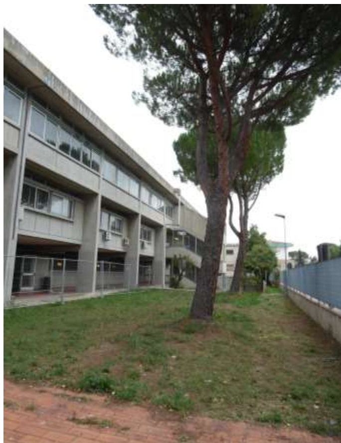
11_ Vista di porzione dell'edificio scolastico e del cortile pertinenziale dall'interno dello stesso.