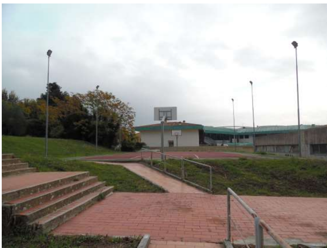
44_Vista verso il campo da basket e il confine con Villa Ragionieri dal percorso pedonale che procede dal campo da pallavolo.