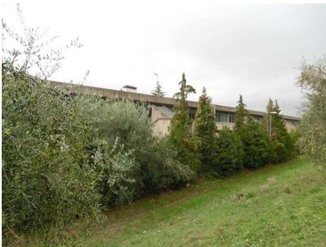
30_ Vista della scuola al livello quasi del secondo balzo aldiquà della siepe costituita da arbusti e piccole alberature.