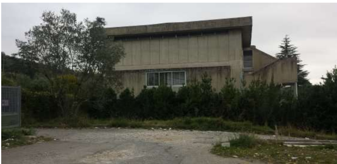
69_ Vista dalla particella 384, verso la particella 143 foglio 37, sul fondo il prospetto laterale dell'edificio scolastico.