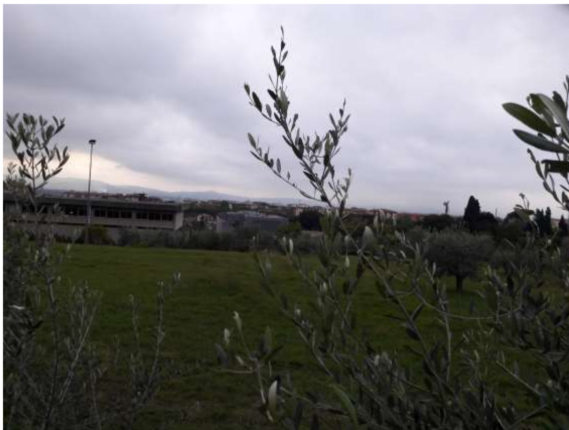
57_Vista da via di Castello, in lontananza si scorgono porzione dell'edificio scolastico e l'edificio O38 dello stabilimento Eli Lilly scheda AT 57, il resto degli edifici dello stabilimento rimangono nascosti dal profilo della scuola.