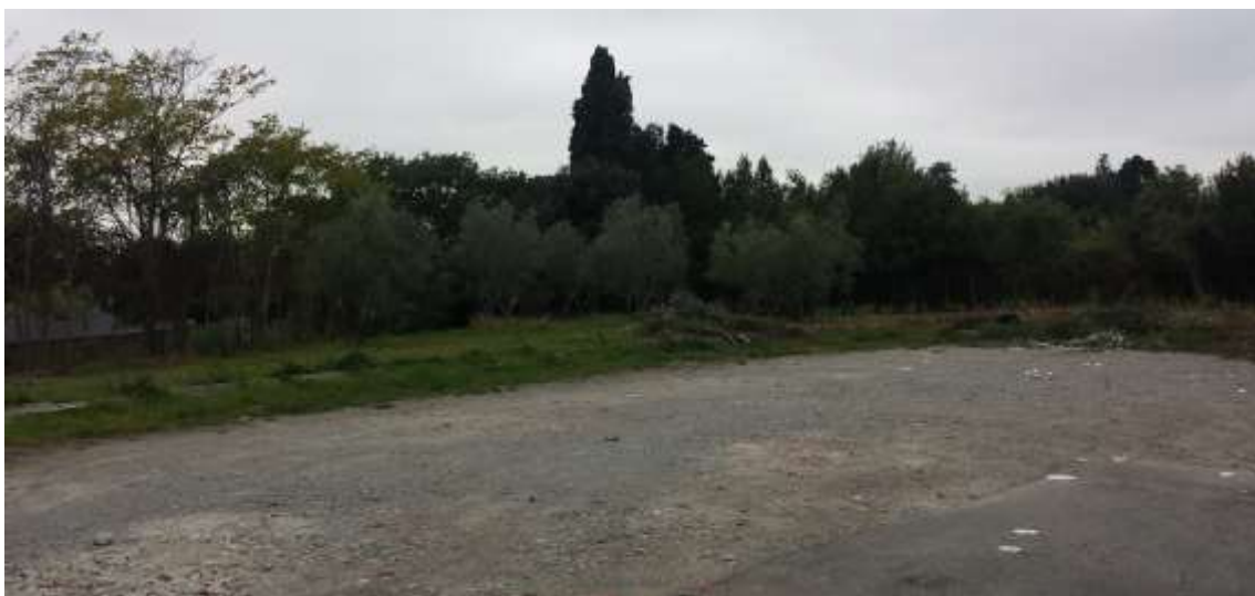
68_ Vista dalla particella 384, foglio 37, sul fondo si intravede il muro di confine con lo stabilimento della Eli Lilly scheda AT57.