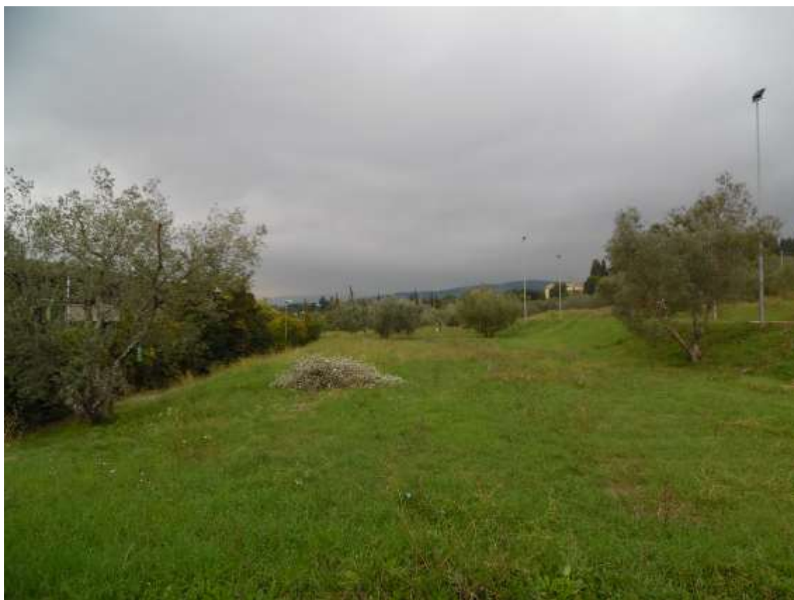
48_Vista dal balzo su cui si trova il campo da pallavolo verso la particella 142 foglio 37.