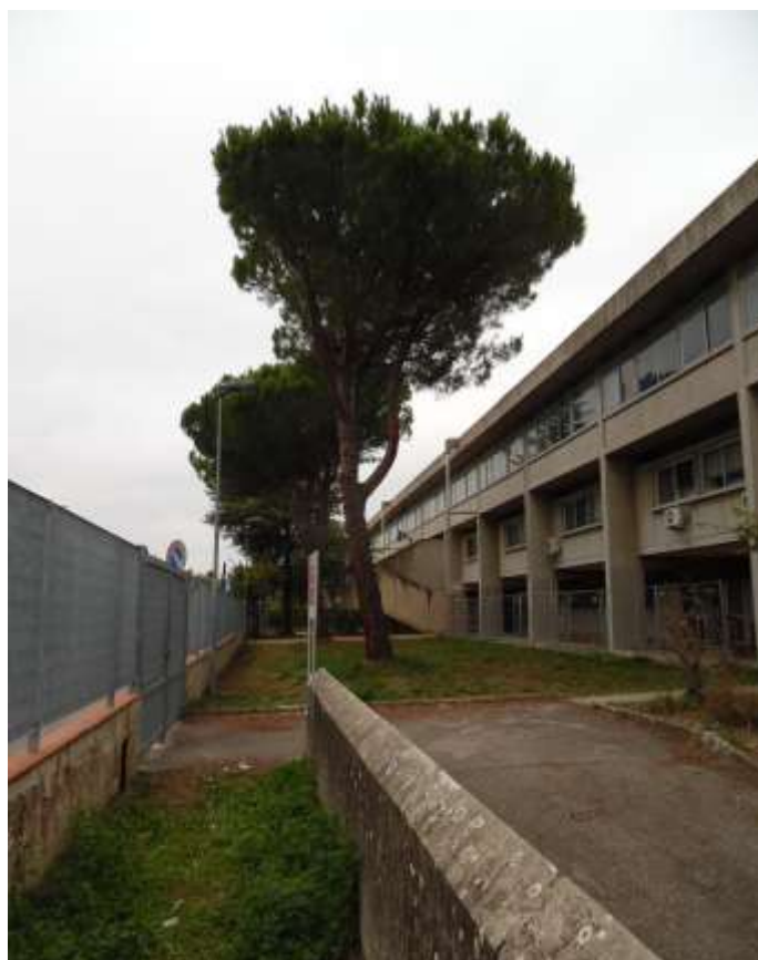
12_ Vista di porzione dell'edificio scolastico e del cortile pertinenziale dall'interno dello stesso.