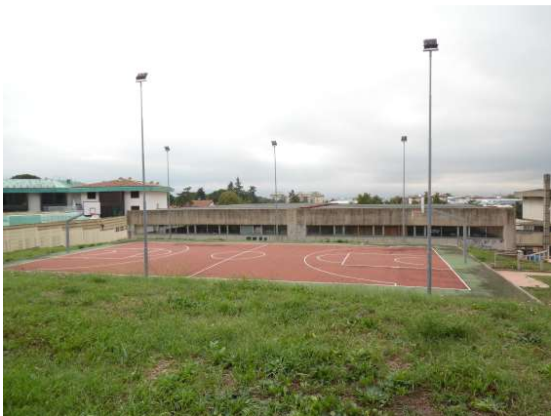
42_ Vista dal balzo del campo da basket e del prospetto tergale del volume della palestra.