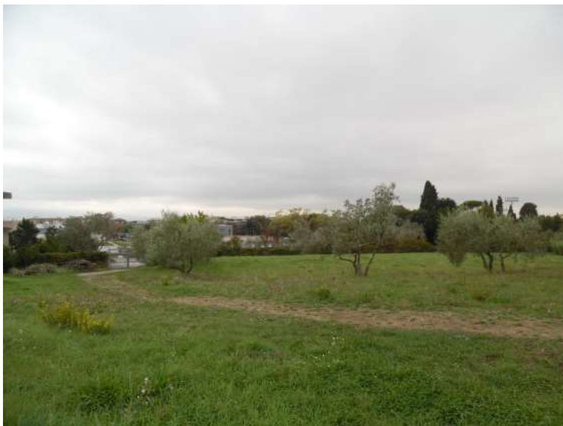
38_ Vista dalla particella 142 foglio 37. L'edificio scolastico esistente rimane sulla sinistra.