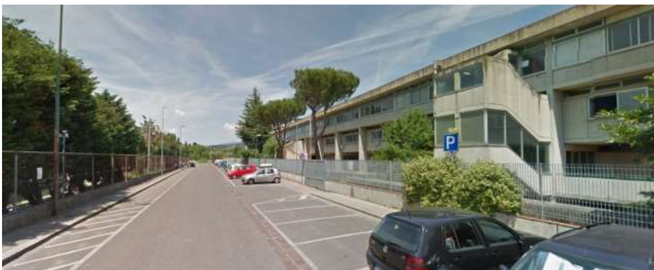
5_Vista del tratto di via Ragonieri lungo l'edificio scolastico verso il fondo della via stessa, sulla sinistra il muro di confine con lo stabilimento Eli Lilly scheda AT 57.