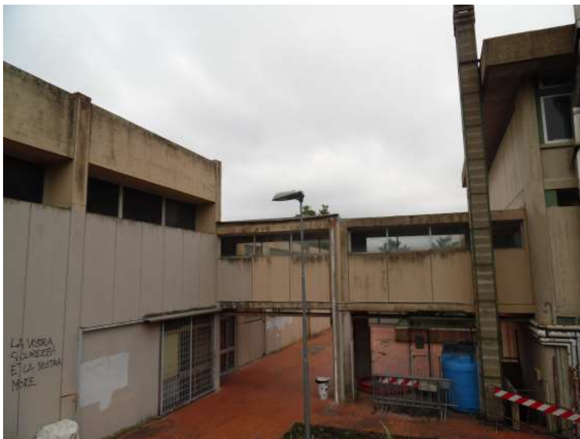
18_ Vista del collegamento aereo tra le aule e la palestra dal balzo subito retrostante la scuola.