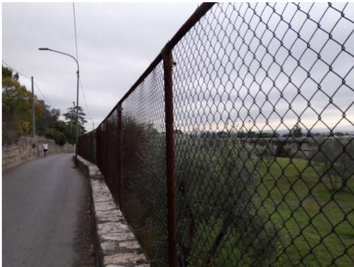
59_Vista di via di Castello, si scorge sulla destra in lontananza il profilo della scuola che copre gli edifici della scheda AT57.