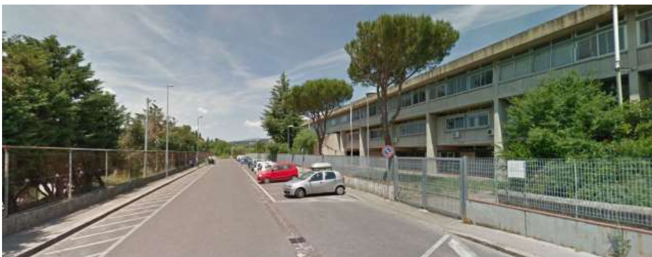
6_Vista del tratto di via Ragonieri lungo l'edificio scolastico verso il fondo della via stessa, sulla sinistra il muro di confine con lo stabilimento Eli Lilly scheda AT 57.