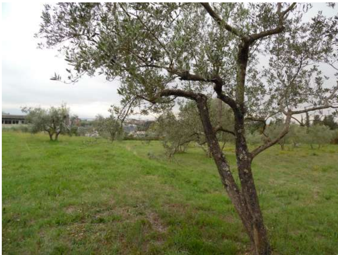
39_ Vista lungo il confine tra la particella 142 e 143 foglio 37. Si vede in scorcio la scuola.