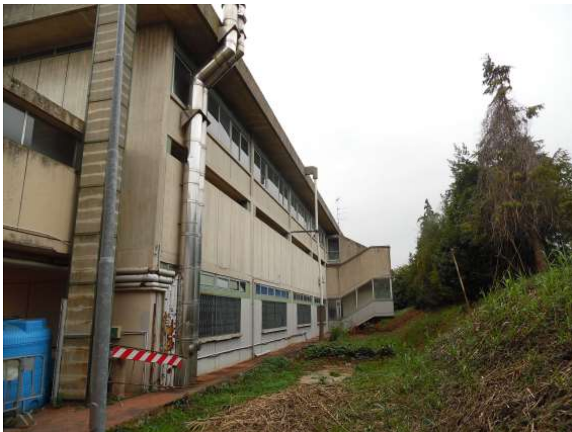
17_ Vista di parte del prospetto tergale della scuola e del balzo creato inseguito alle escavazioni eseguite per la costruzione dell'edificio stesso.