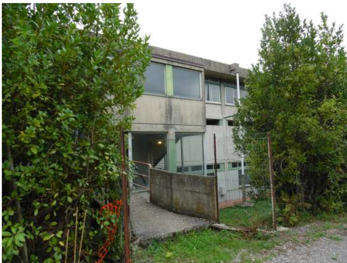
31_ Vista del passaggio tergale che collega la scuola al primo balzo.