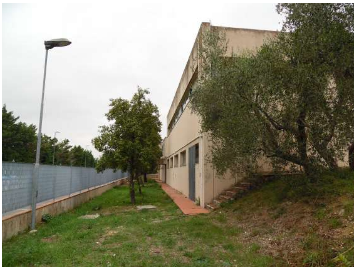
22_ Vista del giardino lungo via Ragionieri dal lato della palestra.