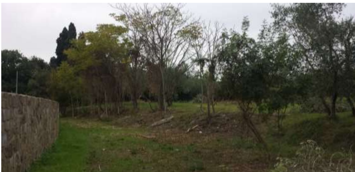
66_ Vista dalla particella 384, foglio 37 in fondo il confine con la particella 656 foglio 37, sulla sinistra il muro di confine con lo stabilimento Eli Lilly scheda AT 57.