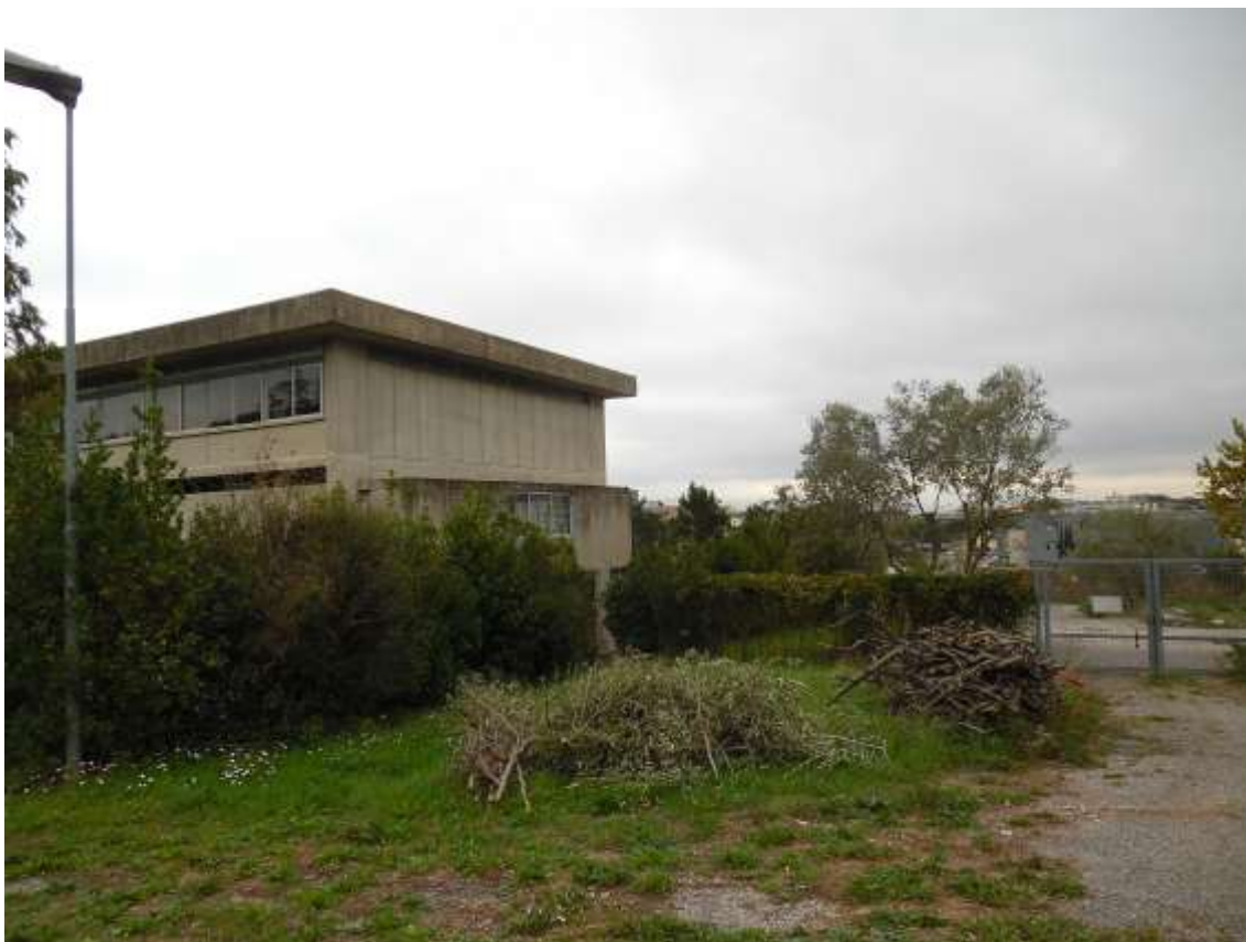
36_ Vista dalla particella 142 foglio 37. Si vedono la scuola e il cancello di accesso alla particella stessa.