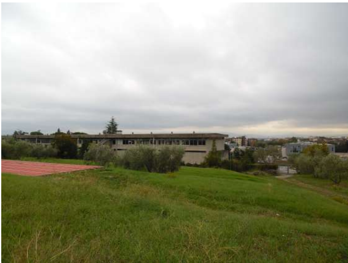
49_Vista dall'ultimo balzo in prossimità del confine con la particella 142 foglio 37 verso la scuola, sulla destra si intravede l'edificio O38 dello stabilimento Eli Lilly scheda At 57.