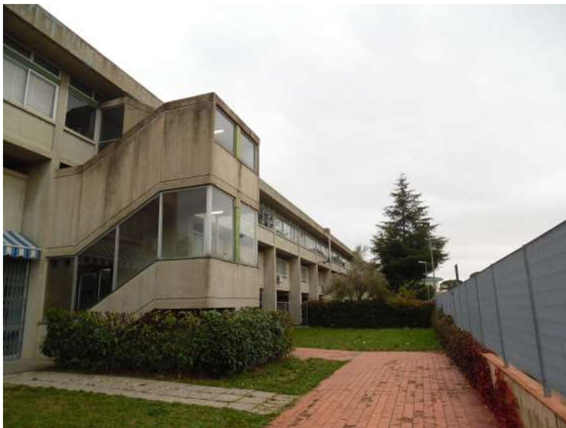
9_Vista di porzione dell'edificio scolastico dall'interno del cortile pertinenziale, sul fondo la recinzione del pozzo di proprietà di Eli Lilly.