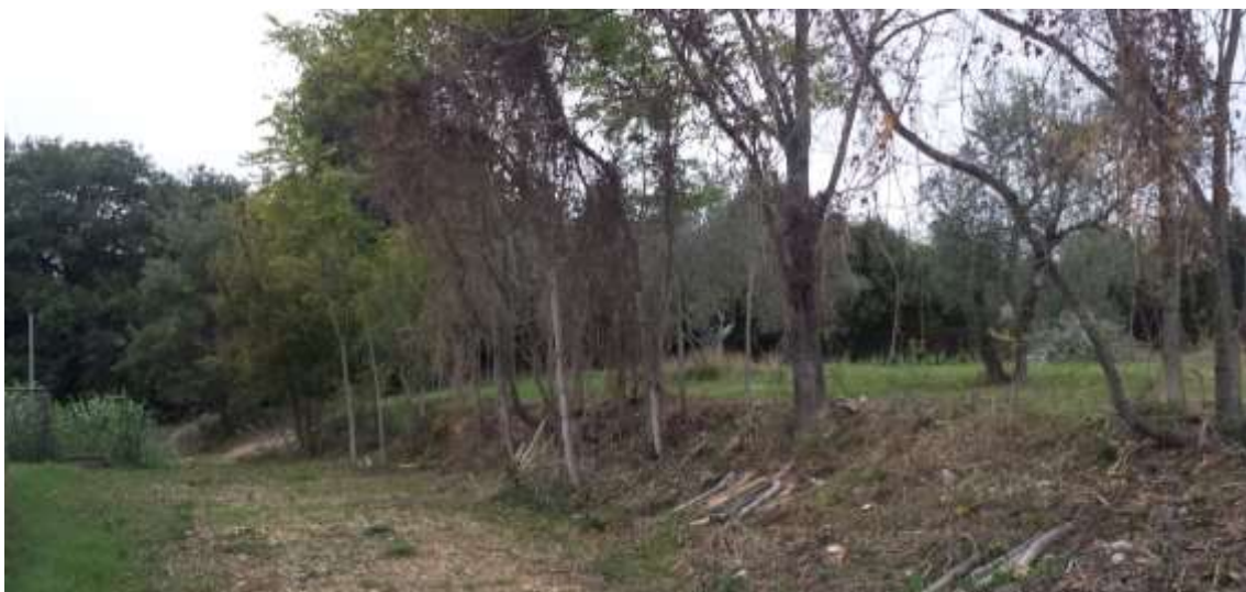
65_ Vista dalla particella 384, foglio 37 verso il confine con la particella 656 foglio 37.