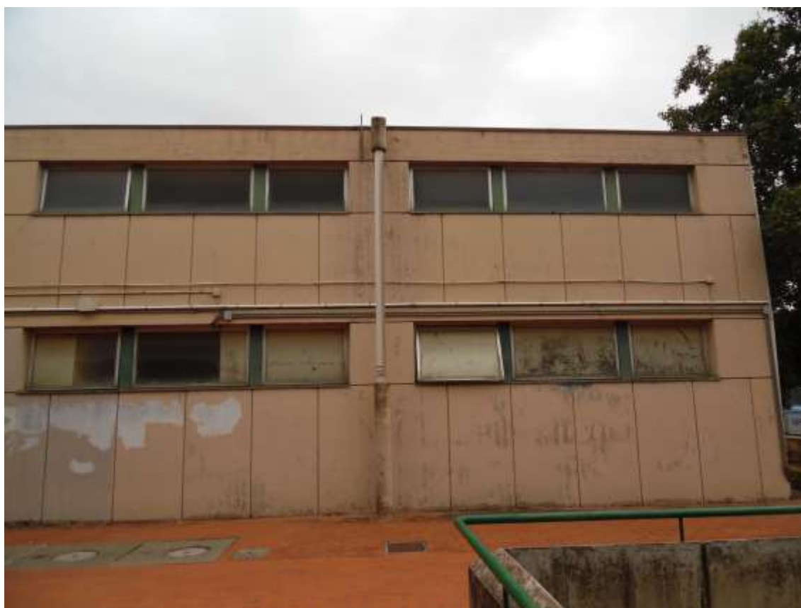
16_ Vista di parte del prospetto della palestra adiacente al corridoio di collegamento aereo.