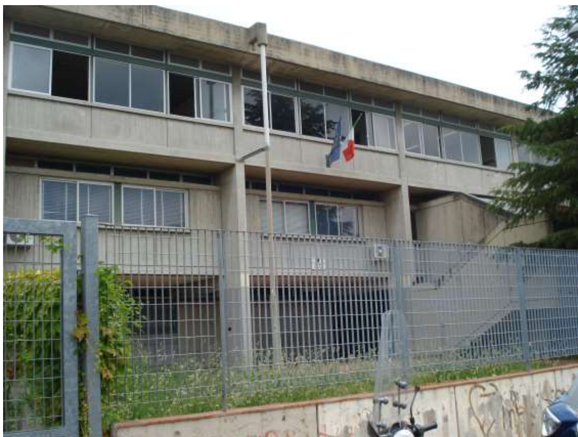
7_Vista di porzione del prospetto principale dell'edificio scolastico da via Ragionieri.