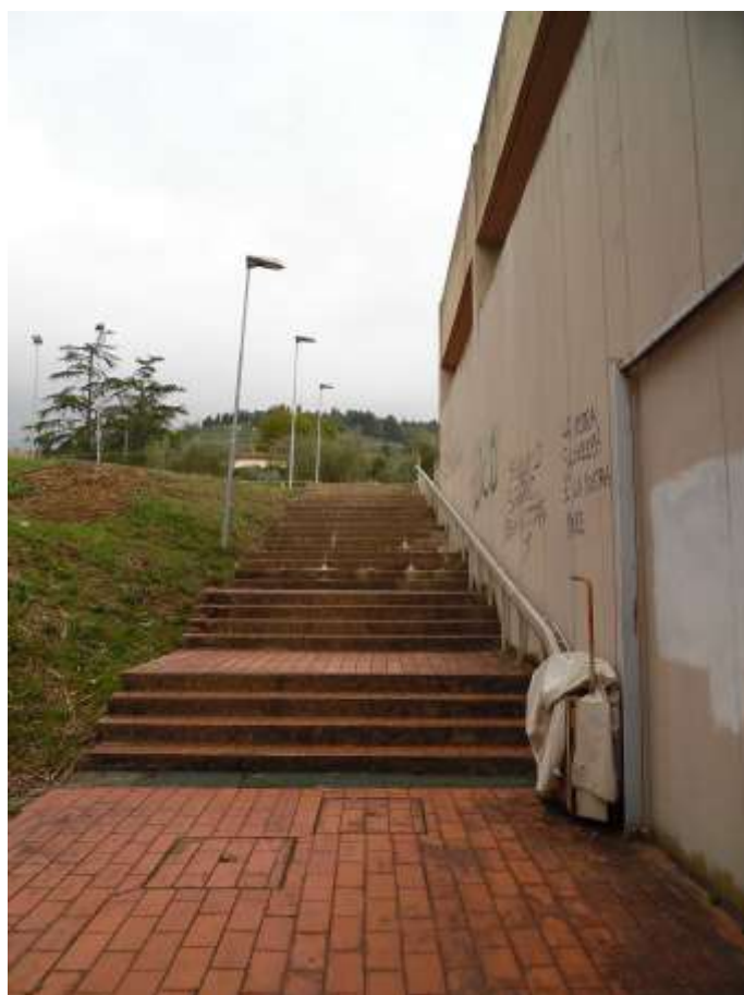
28_ Vista delle scale che permettono il superamento del dislivello creato dai balzi.