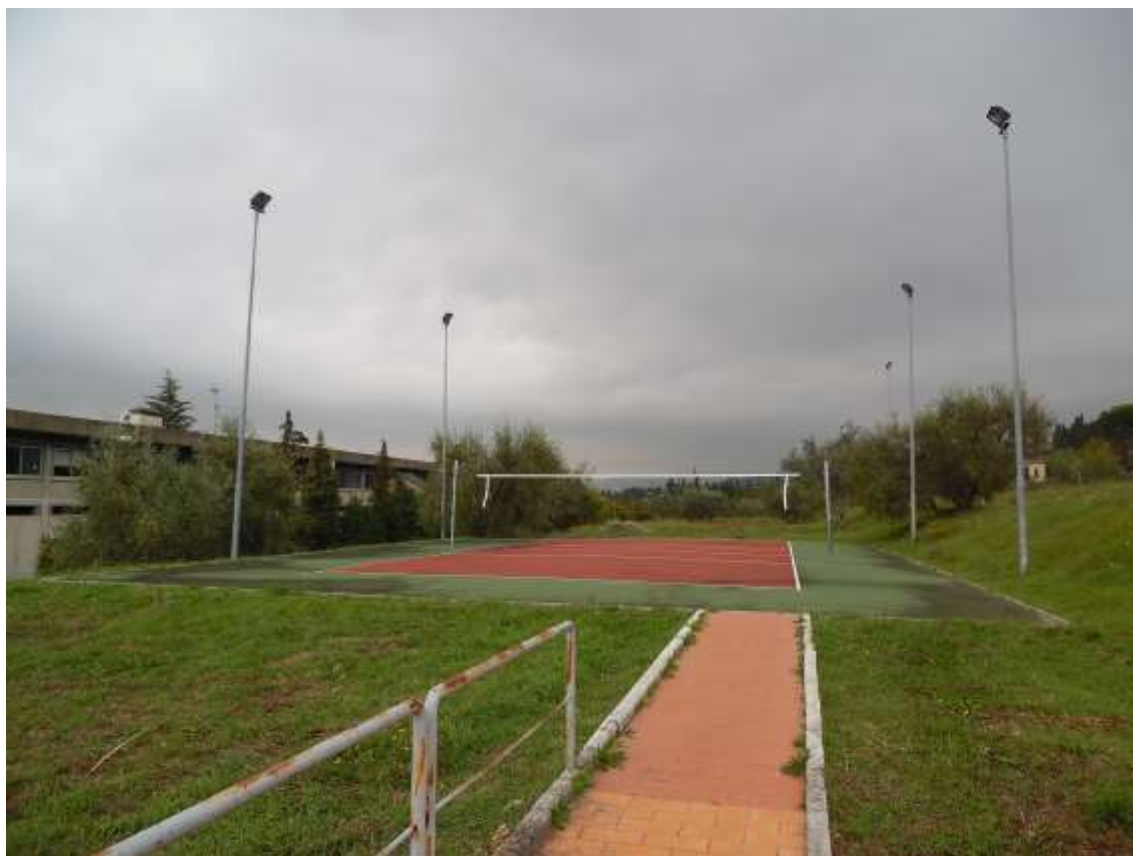
45_Vista verso il campo da pallavolo e il confine con la particella 142 foglio 37 dal percorso pedonale.