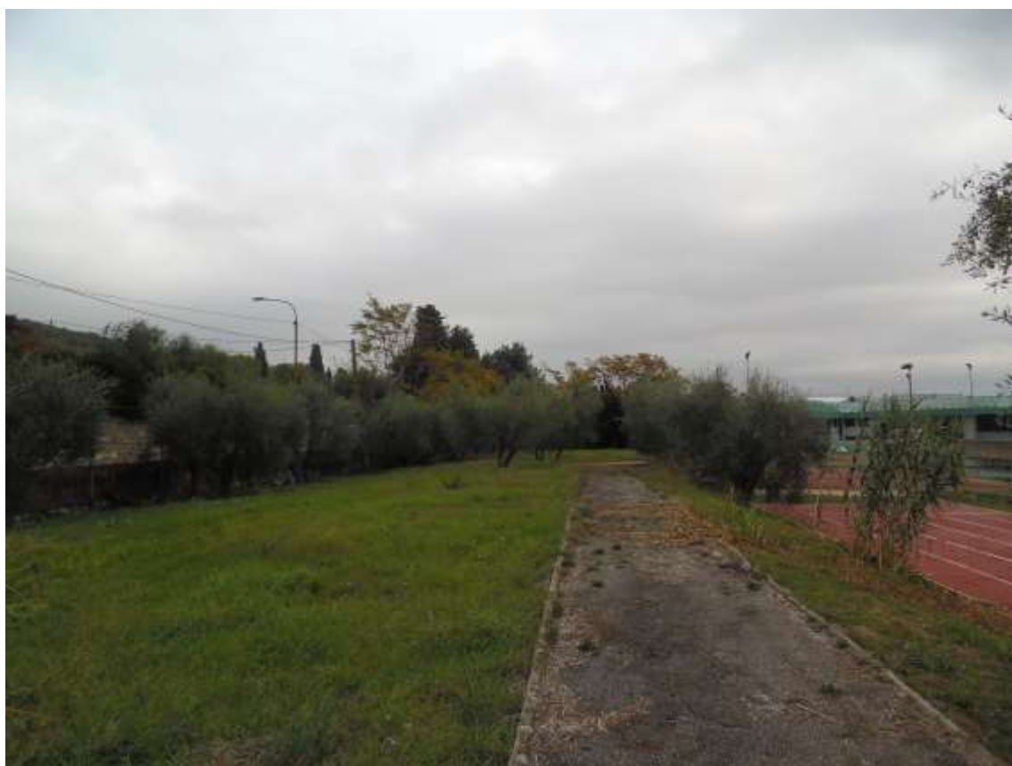
54_Vista dal percorso pedonale sull'ultimo balzo verso il confine con Villa Ragionieri.