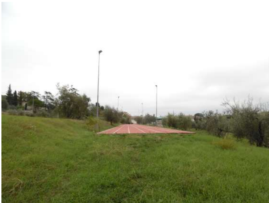
51_Vista dal fondo della pista di atletica verso il confine con Villa Ragionieri.