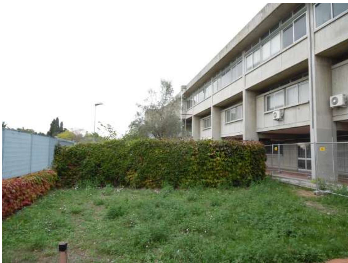
10_Vista di porzione dell'edificio scolastico dall'interno del cortile pertinenziale e dell'area recintata con all'interno il pozzo di proprietà di Eli Lilly.