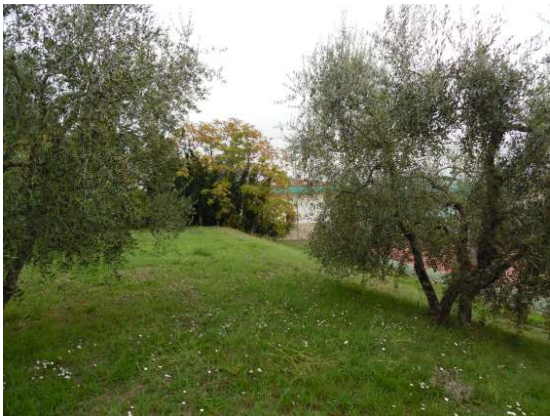
47_Vista dall'ultimo balzo prima del muro di confine con via di Castello verso la proprietà di Villa Ragionieri.