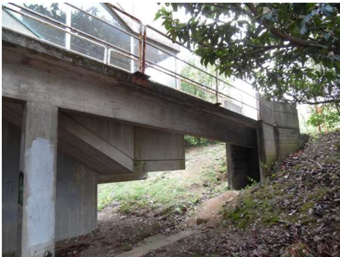
32_ Vista da sotto del ponticello tergale che collega la scuola al primo balzo.