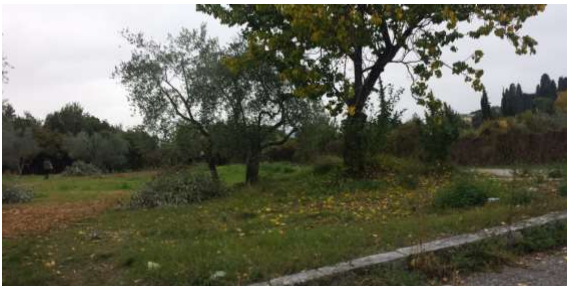
67_ Vista dalla particella 384, foglio 37.