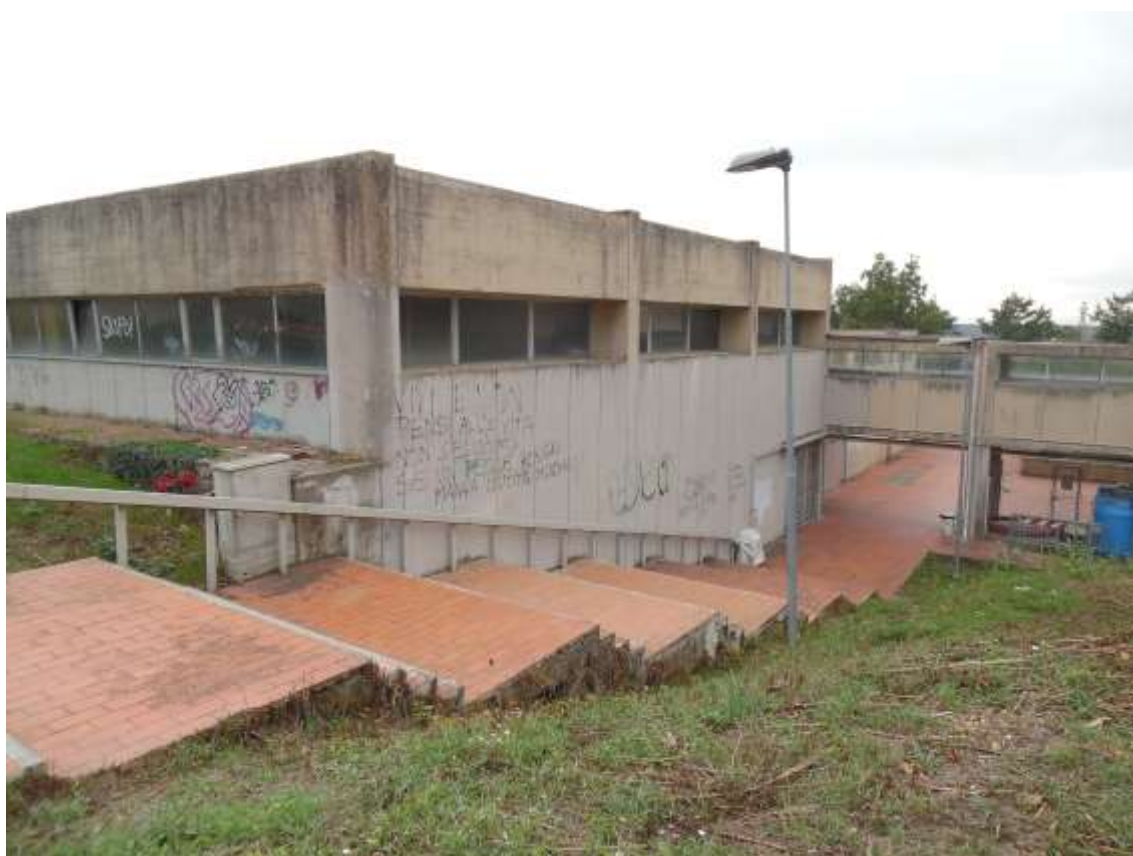
20_ Vista della scalinata retrostante l'edificio della scuola che permette il superamento del dislivello determinato dai balzi.