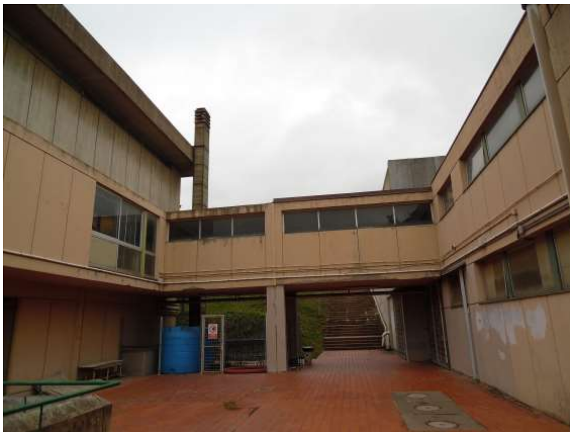
15_ Vista del corridoio aereo che lo collega la palestra con le aule.