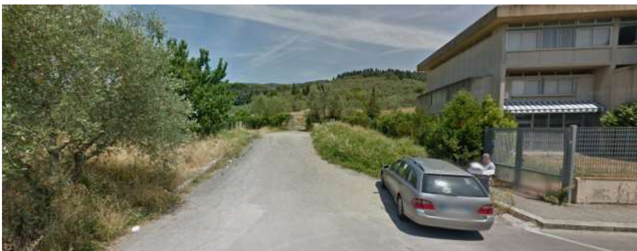
2_Vista da via Ragonieri verso la collina e il cancello che dà sulla particella 142 foglio 37.