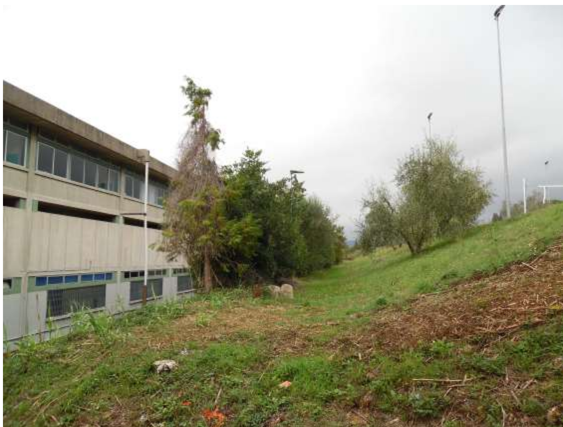
29_ Vista della scuola dal livello determinato dal primo balzo.