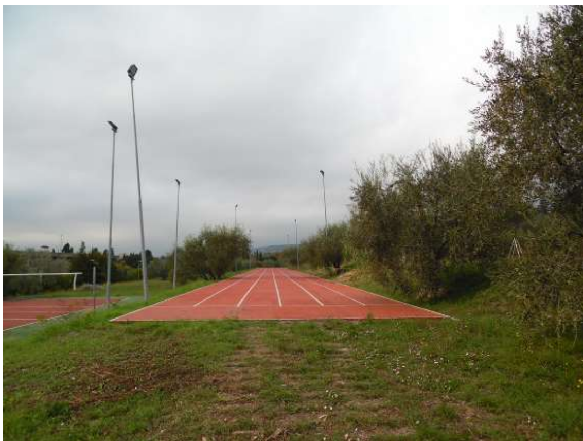
46_Vista della pista di atletica verso il confine con la particella 142 foglio 37.