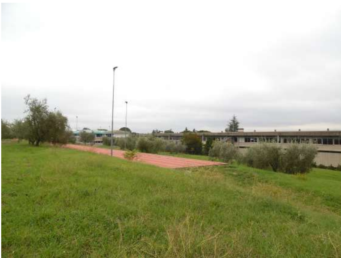
50_Vista dall'ultimo balzo in prossimità del confine con la particella 142 foglio 37 verso la scuola.