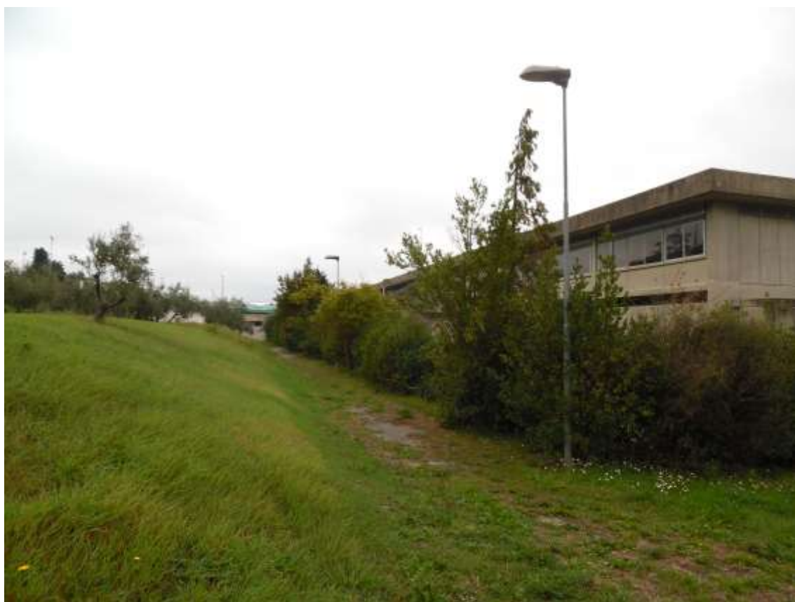
34_ Vista della scuola a livello quasi del secondo balzo aldiquà della siepe esistente costituita da arbusti e piccole alberature.