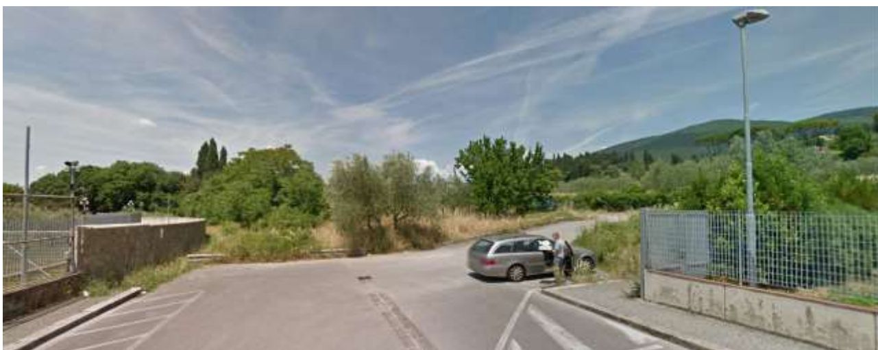
3_Vista del fondo di via Ragonieri verso le particelle 384 e 385 foglio 37.