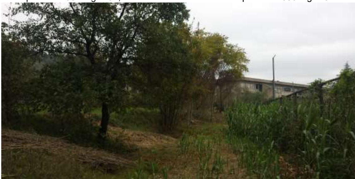
64_Vista dalla particella 384, foglio 37 verso l'edificio scolastico che si intravede di scorcio.