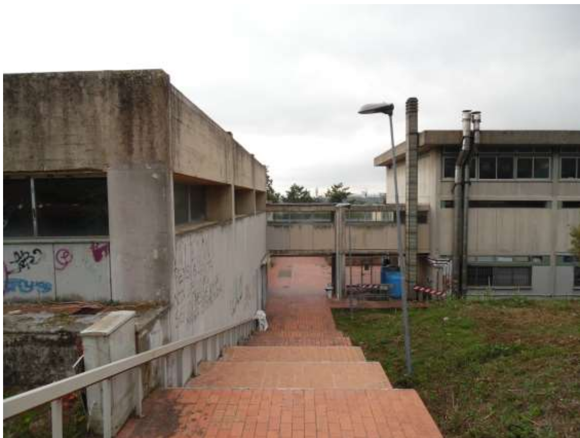
21_ Vista della scalinata retrostante l'edificio della scuola, che permette il superamento del dislivello determinato dai balzi, e di porzione del fabbricato stesso.