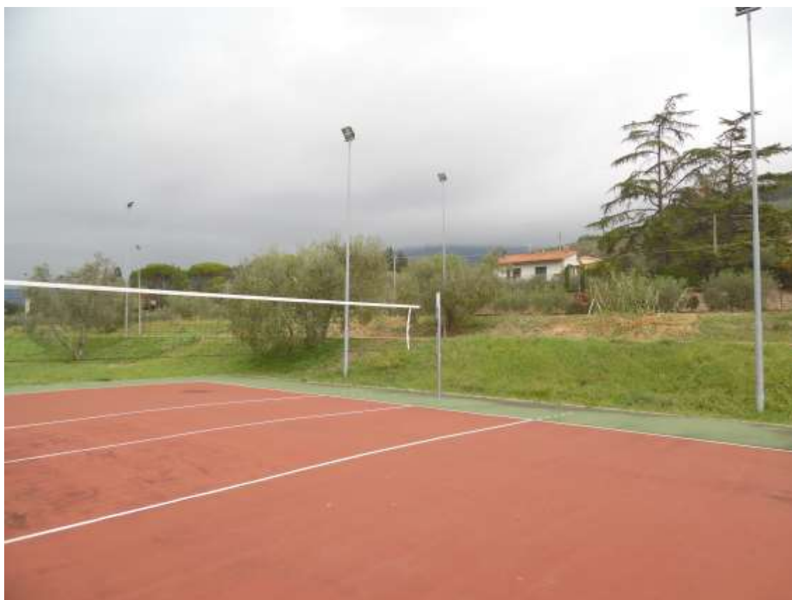
40_ In primo piano vista del campo da pallavolo esistente, dietro i balzi e il muro di confine su via di Castello.