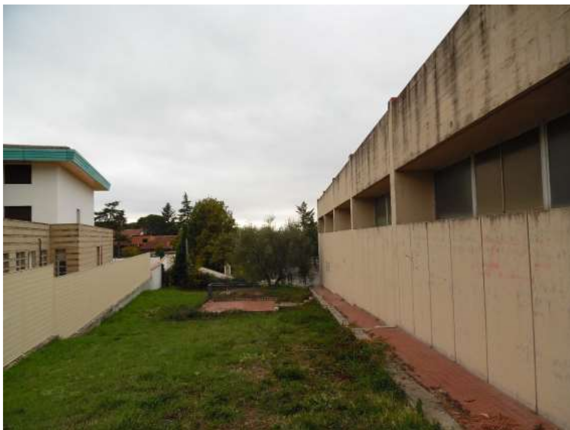
23_ Vista del giardino e del prospetto della palestra lungo il confine con Villa Ragionieri.