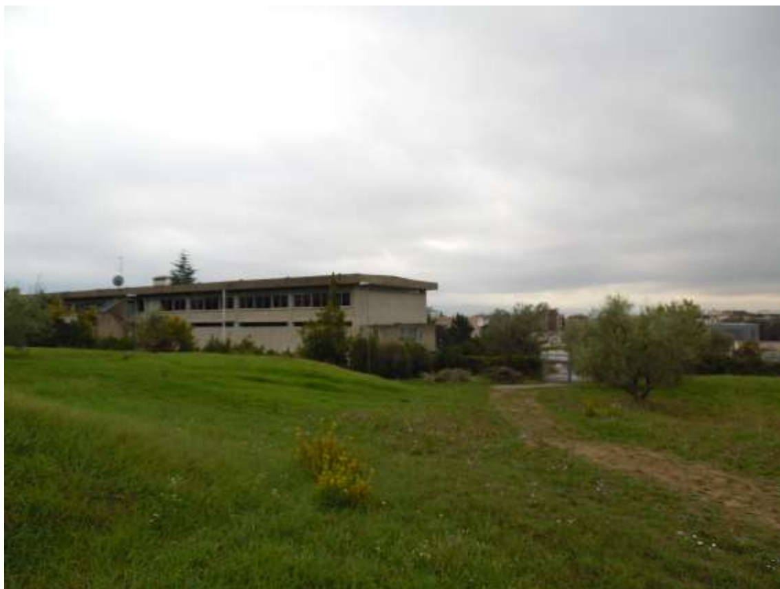
37_ Vista dalla particella 142 foglio 37. Dall'immagine si evince l'andamento naturale del terreno sulla destra, mentre sulla sinistra il profilo è determinato dalla presenza dei balzi, costituiti da materiale di riporto.