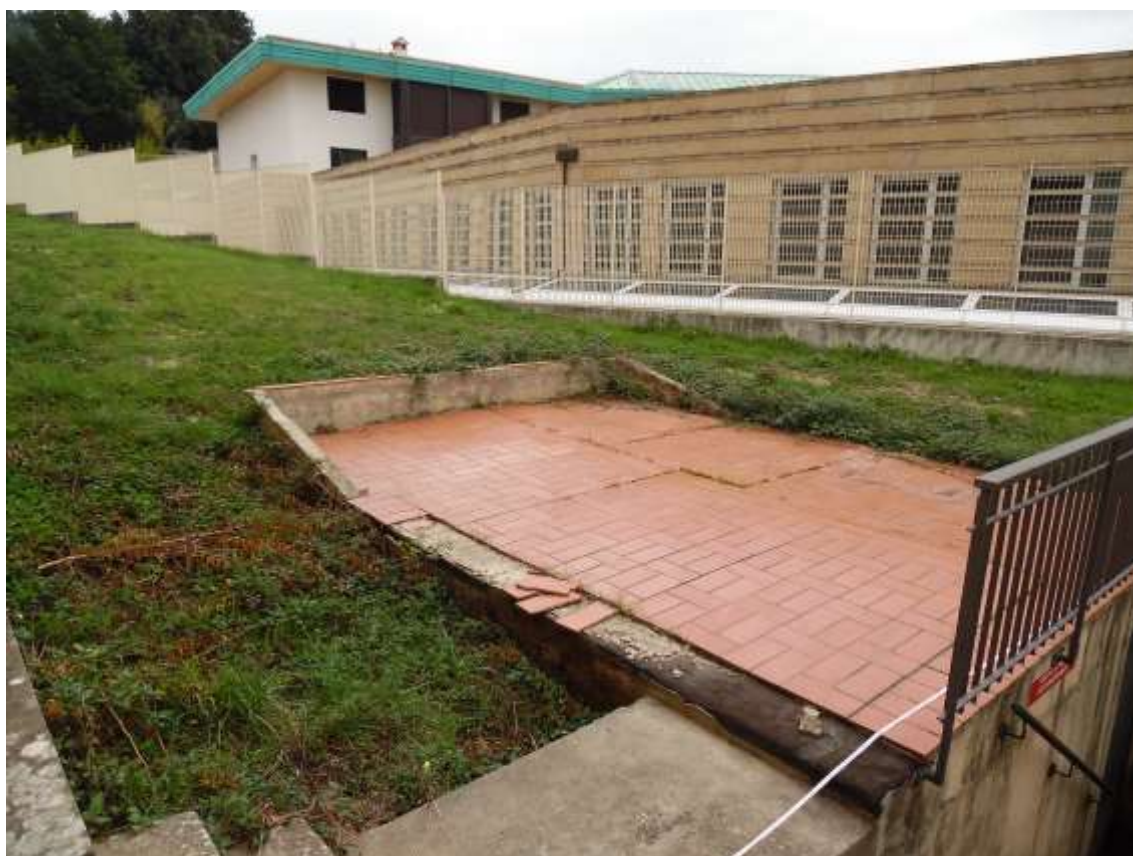
25_ Vista del manufatto tecnico interrato a supporto del fabbricato scolastico lungo il confine con Villa Ragionieri.