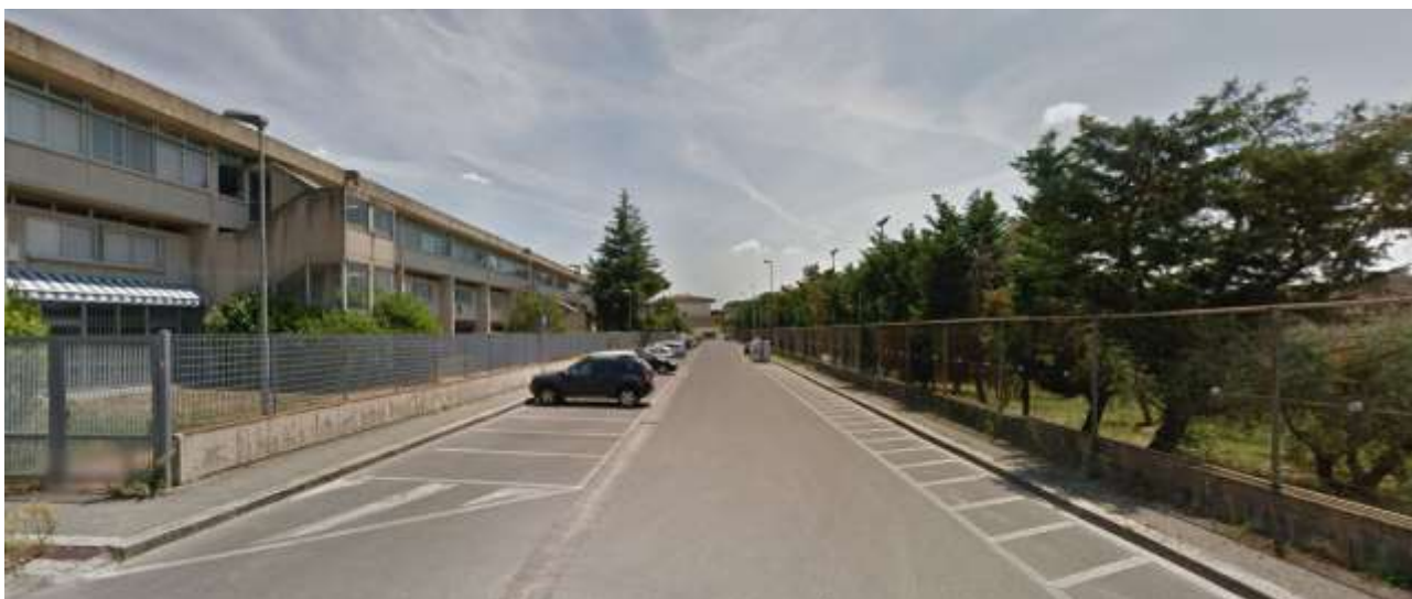
4_Vista del tratto di via Ragonieri lungo l'edificio scolastico dal fondo della via stessa, sulla destra il confine con lo stabilimento Eli Lilly, scheda AT 57.