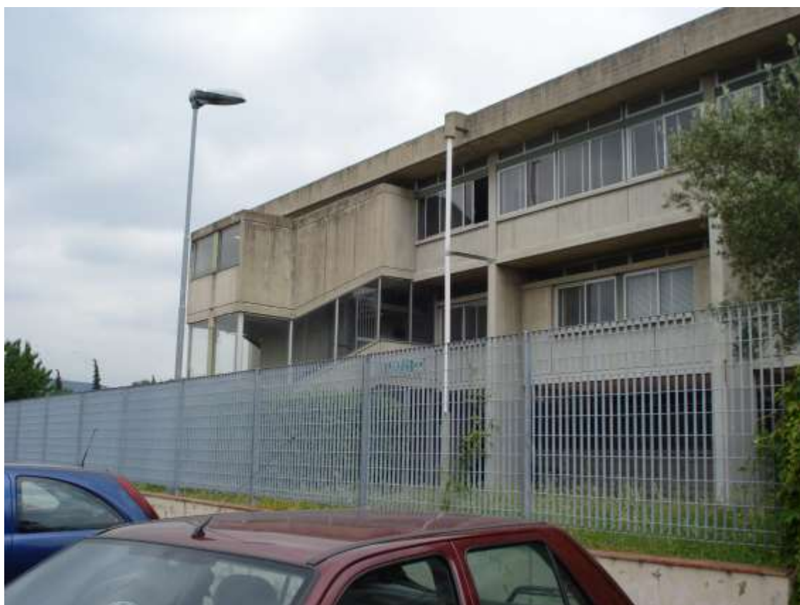
8_Vista di porzione del prospetto principale dell'edificio scolastico da via Ragionieri.