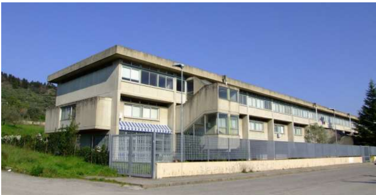
1_Vista dell'edificio scolastico esistente da via Ragonieri.