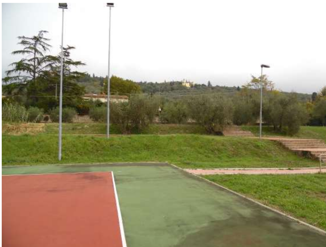
41_ In primo piano vista di porzione del campo da pallavolo esistente, dietro i balzi, le scale per il superamento degli stessi e il muro di confine su via di Castello.