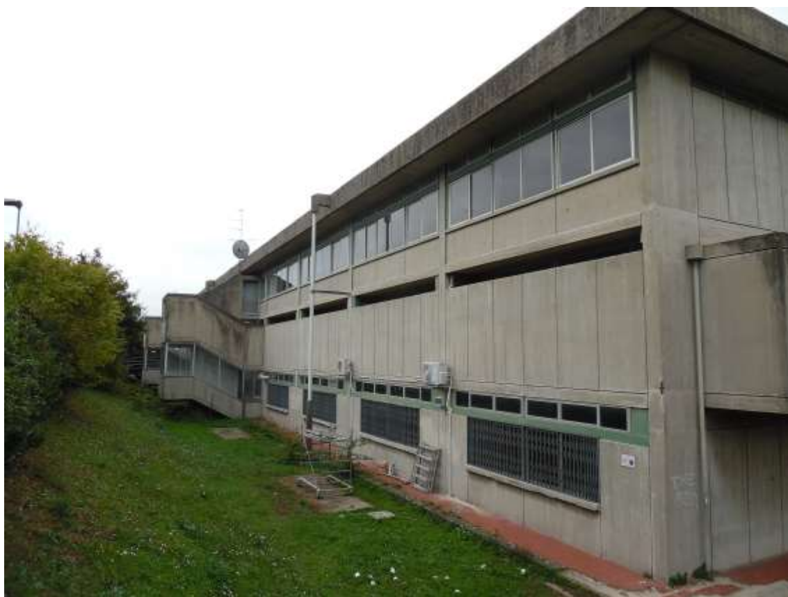
33_ Vista della scuola dal primo balzo lungo la siepe esistente.