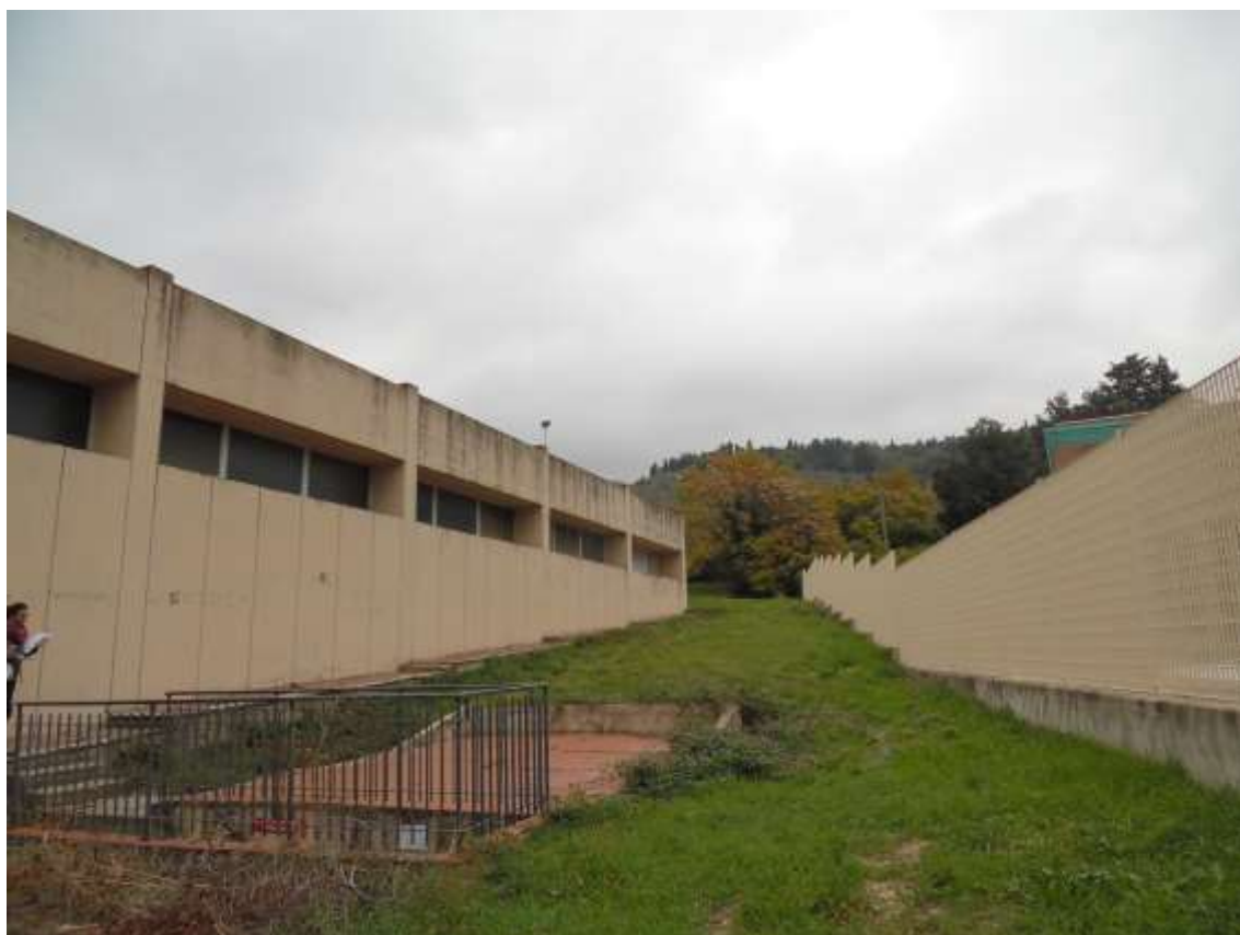
26_ Vista lungo il confine con Villa Ragionieri del manufatto tecnico interrato a supporto del fabbricato scolastico, di uno dei prospetti laterali della palestra e di porzione del giardino.