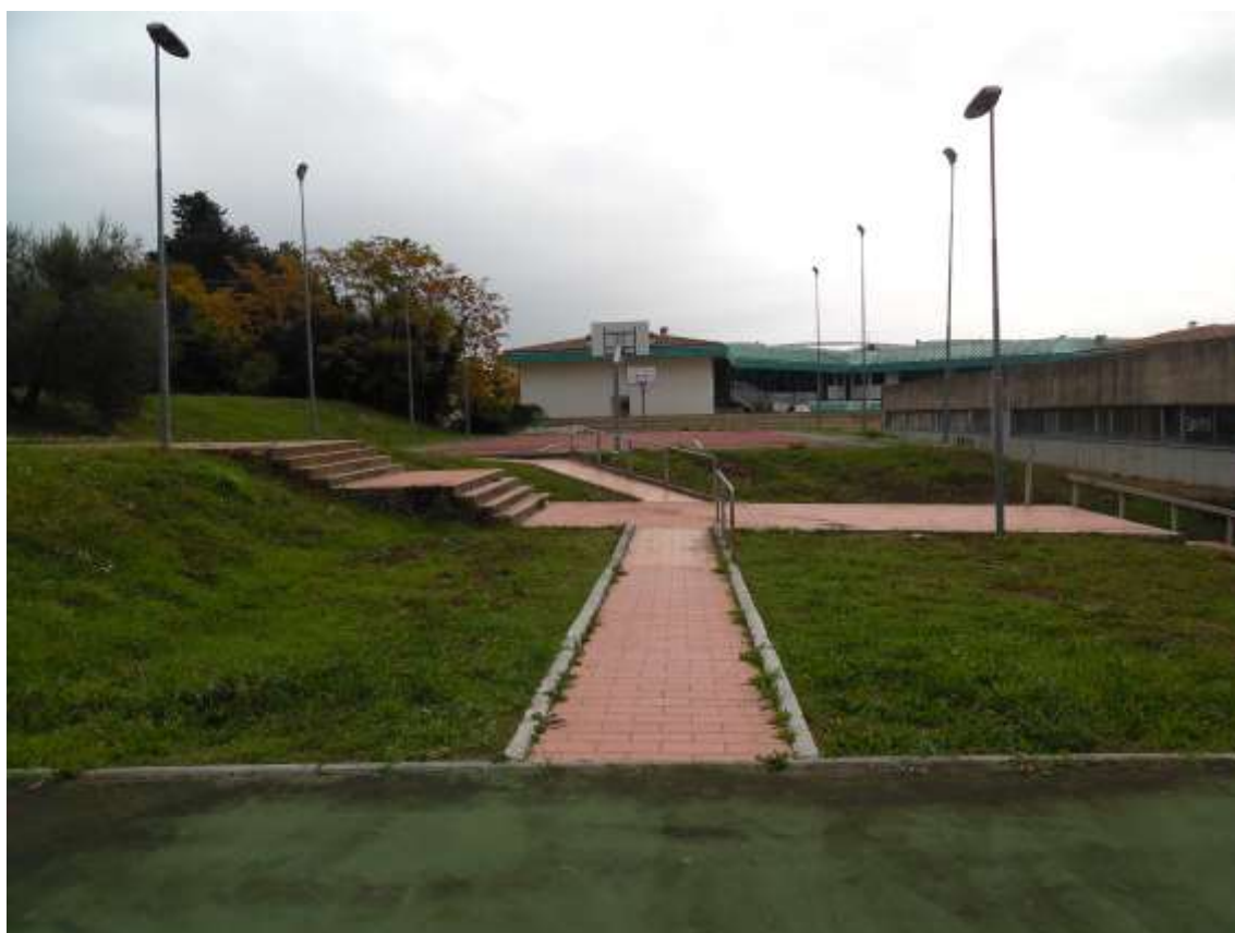
43_Vista dal limite del capo di pallavolo verso il campo da basket e il confine con Villa Ragionieri.