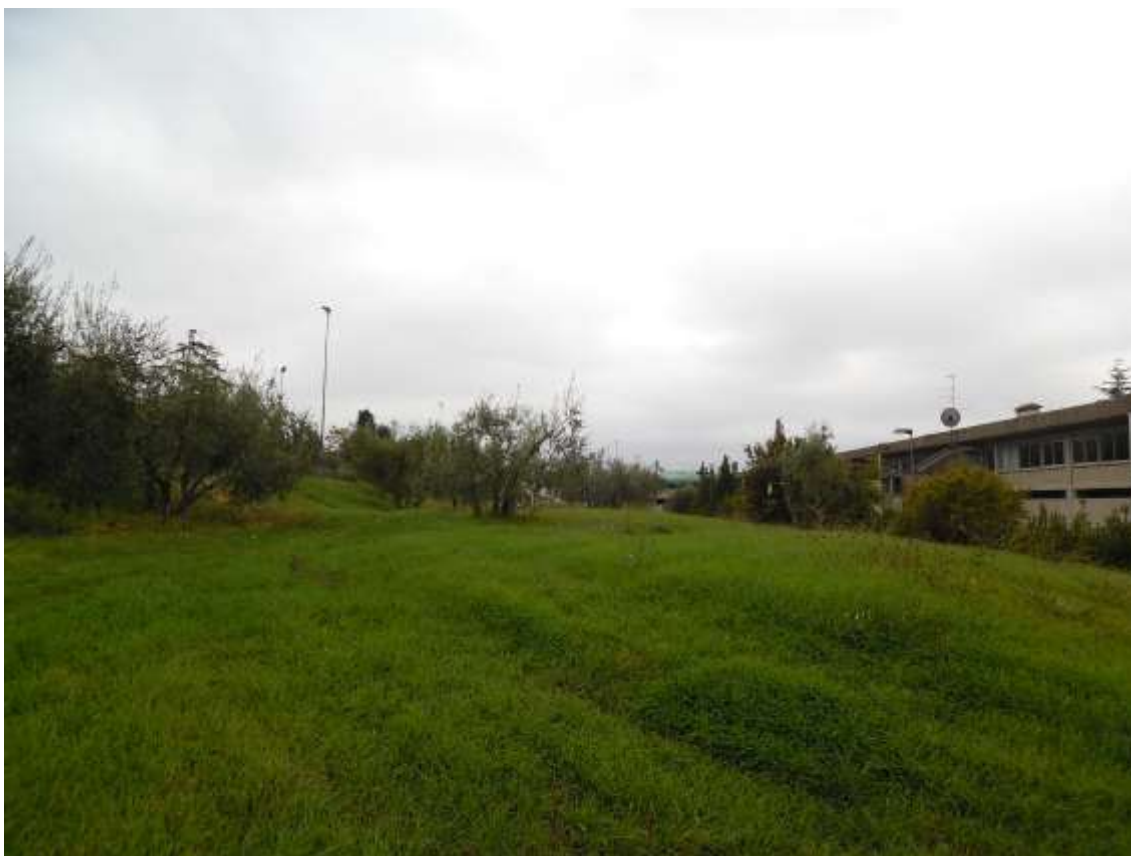
35_ Vista dal secondo balzo, si scorgono gli olivi e porzione del prospetto tergale della scuola. I balzi sono il risultato del deposito di materiale di scavo eseguito durante l'edificazione della scuola stessa.