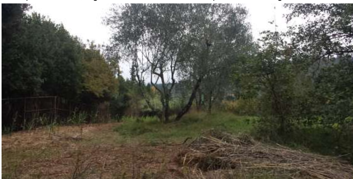
62_Vista dalla particella 384 foglio 37, sulla sinistra il confine con la particella 656 foglio 37.