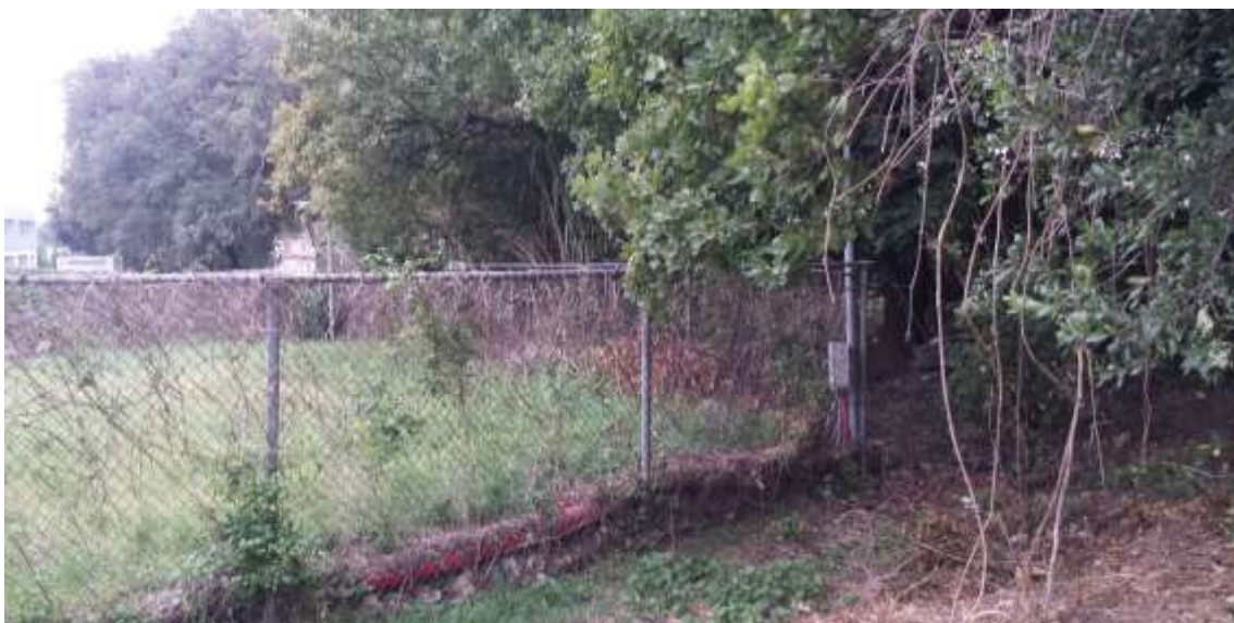
61_Vista dalla particella 384, foglio 37 verso il confine con la particella 385 foglio 37.