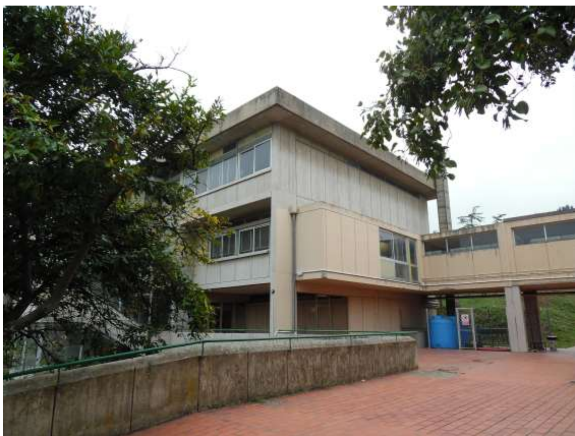
14_ Vista di parte dell'edificio scolastico e del corridoio aereo che collega la palestra con le aule.