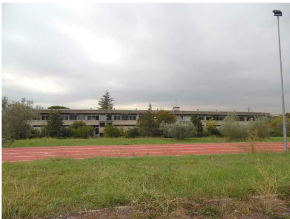
52_Vista di porzione del prospetto tergale della scuola dal balzo sopra la pista di atletica.