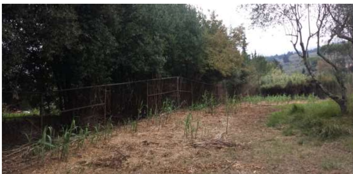
60_Vista dalla particella 384, foglio 37 verso il fosso esistente che delinea il confine con la particella 656 foglio 37.