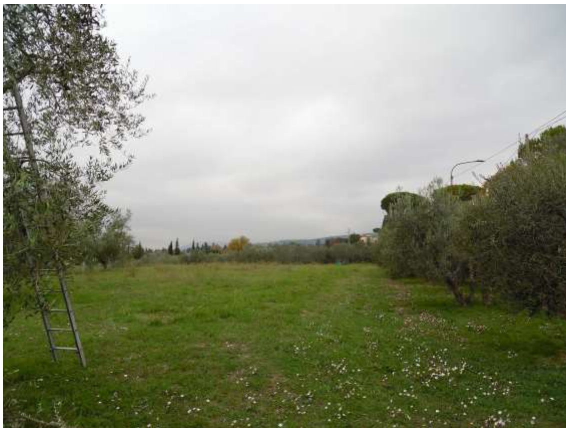
55_Vista dall'ultimo balzo in prossimità del muro di confine con via di Castello verso la particella 142 foglio 37.