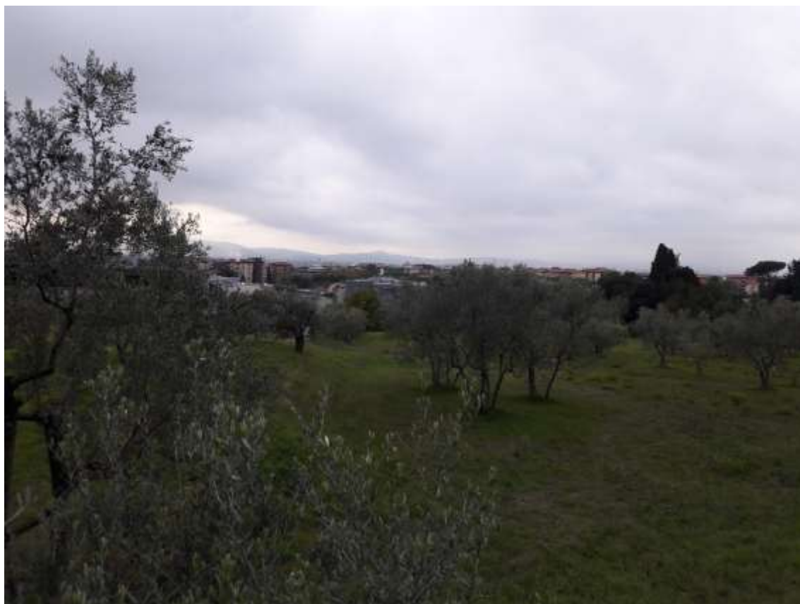
58_Vista da via di Castello, in prossimità del confine tra la particella 142 e 143 foglio 37.