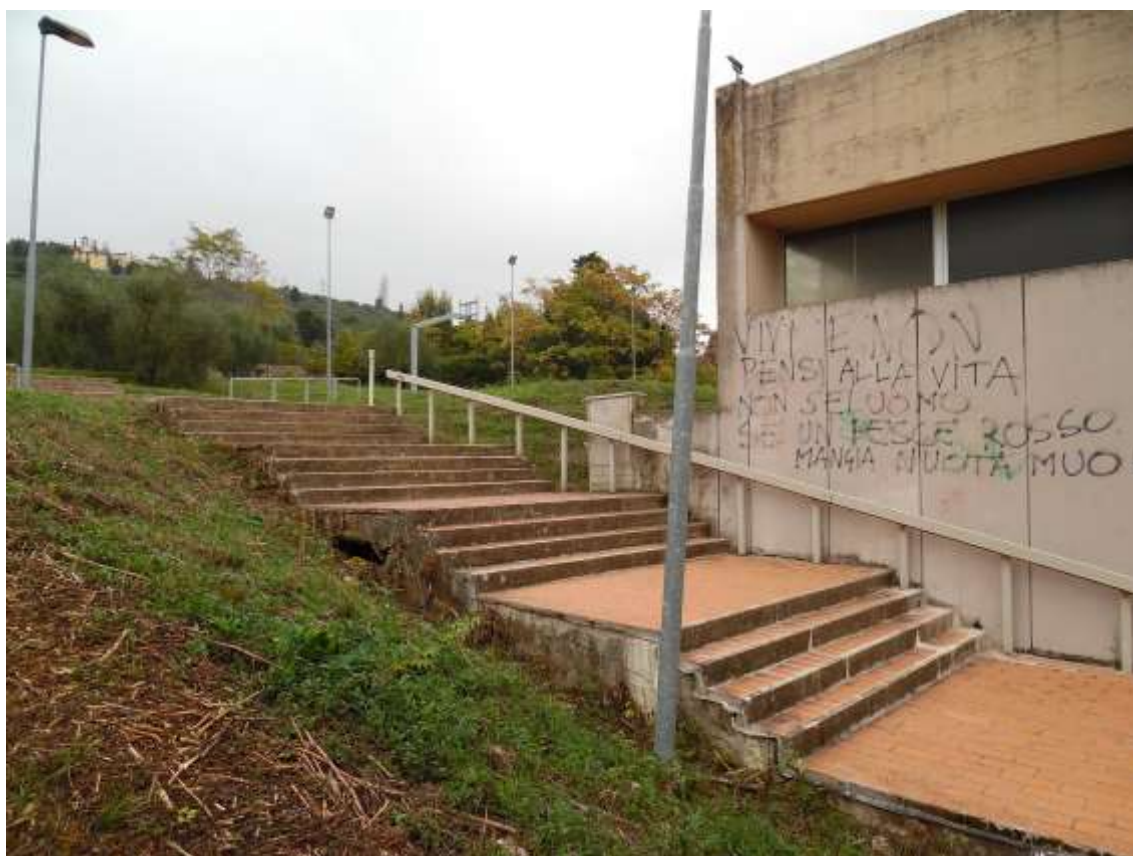
19_ Vista della scalinata retrostante l'edificio della scuola che permette il superamento del dislivello determinato dai balzi.