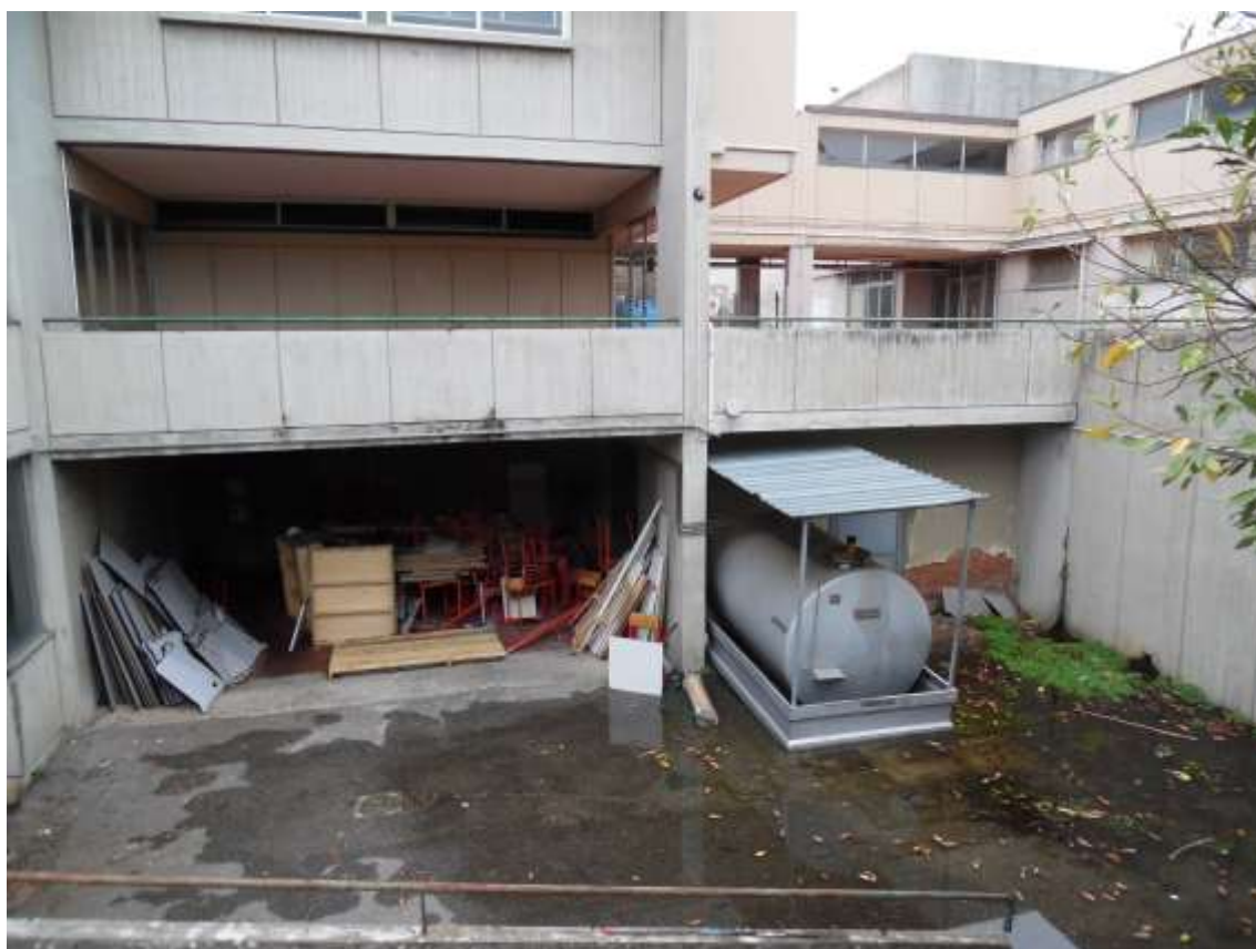
13_ Vista della porzione seminterrata della scuola da cui si accede alla centrale elettrica e ad altri locali tecnici.