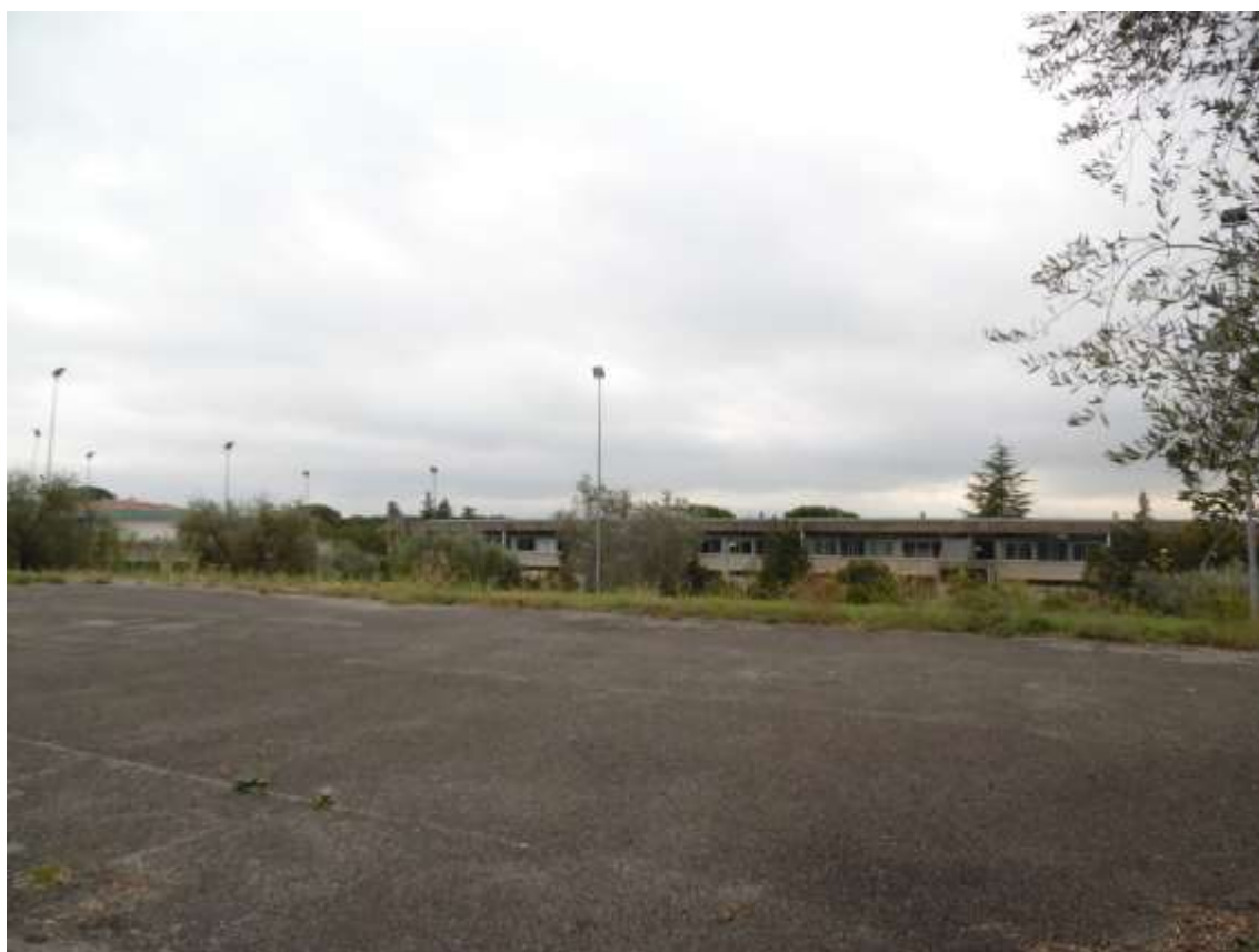
56_Vista dall'ultimo balzo in prossimità del muro di confine con via di Castello verso il prospetto tergale della scuola, sulla sinistra si scorge porzione di Villa Ragionieri.